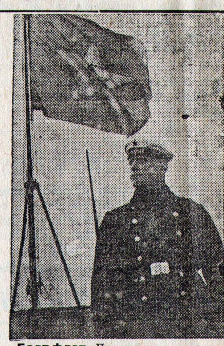
Балт флот. На снимке: на вахте у гюйсшкота.

По постановлению СНБ Союза ССР действующие единые розничные цены на животное масло с 16 июня 1936 года снижены по всем сортам: на масло «Экстра» — на 2 рубля за килограмм и на масло высшего сорта — на 1 рубль за килограмм.