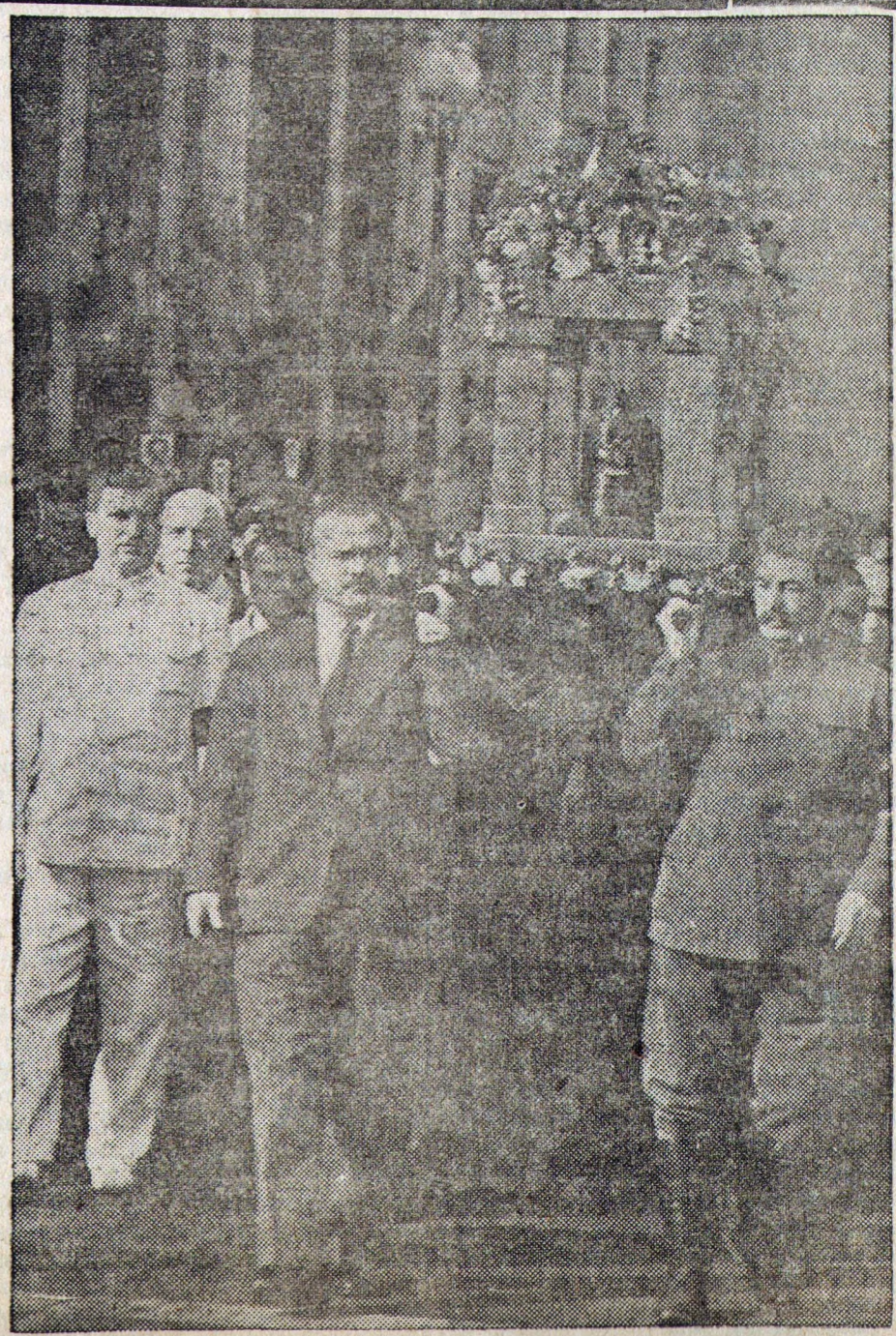
Похороны А. М. Горького. На снимке: вынос урны с прахом А. М. Горького из Дома Союзов. Несут урну гг. Сталин, Молотов, и Каганович. Слева идут гг. Чубарь, Жданов и Демьян Бедный.