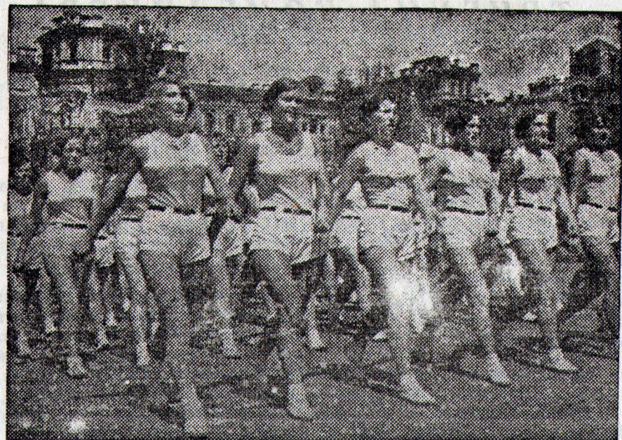
24 июня трудящиеся Киева отметили грандиозным факельным парадом вторую годовщину передела Украинской столицы в Киев. На снимке: прохождение колонны физкультурниц.

Отряд в 150 повстанцев 28 июня напал на полицейское управление в Цингуйшане, расположенный по железной дороге Андун—Мукей. Тяжело ранены двое японских полицейских. К месту нападения посланы японские войска из Финчэна. Газета «Асахи» сообщает, что в Пограичанью обстрел неизвестных подтвердился 4 японских офицера, из которых два убиты.