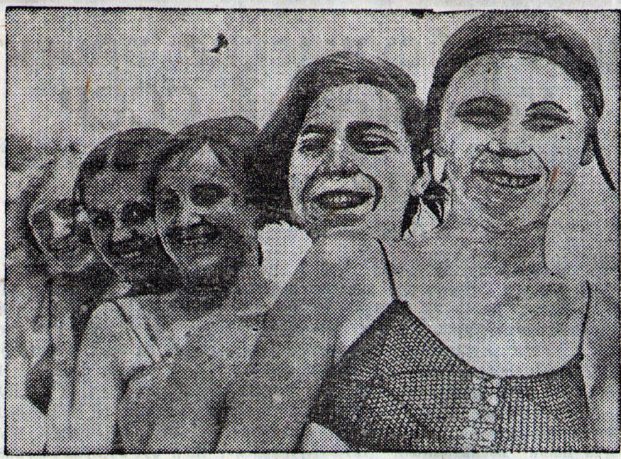
На Энгельской детской водной станции во время республиканского праздника отличников учебы. На снимке: группа учениц.