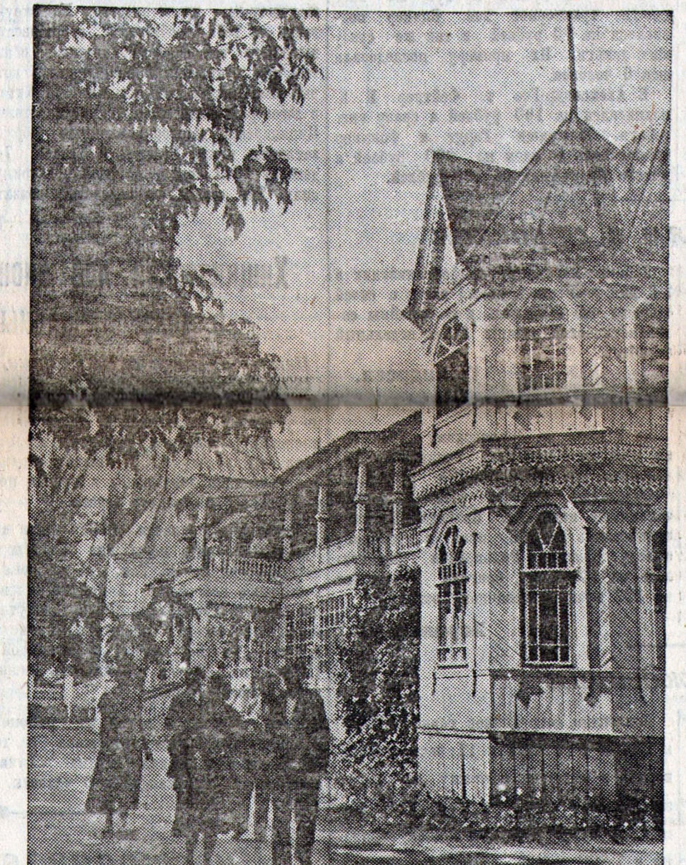
Среди грязелечебных курортов Союза одно из первых мест по качеству грязи занимает привольский курорт «Тинаки» (Сталинградский край).

Величественным химкинским узлом сооружений оживляется 128 километровый канал Москва—Волга. Здесь строительная канализация разрешена исключительно сложная задача.