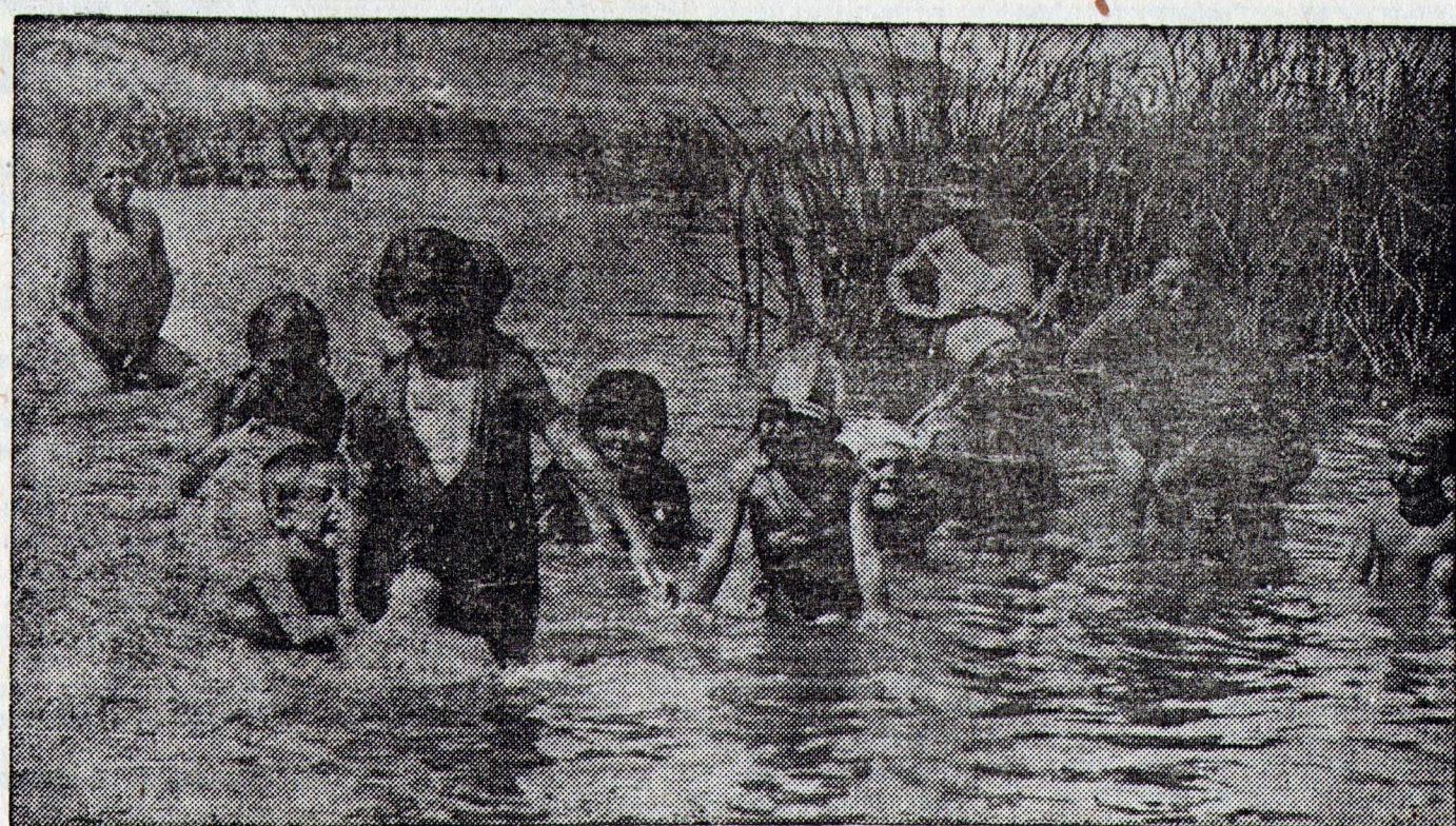
Дети рады лету. Целые дни проводят они вне дома, — на солнце, в воде. Купаются не снимая платья, чтобы дольше чувствовать прохладу. На снимке: ребята из колхоза с Розенфельд, Марьянтальского кантона, купаются в реке.

и предлагает комитету координации рассмотреть вопрос о санкциях, которые были установлены, и принимая во внимание декларацию, сделанную по этому поводу на пленуме Лиги, рекомендовать правительствам необходимые решения».