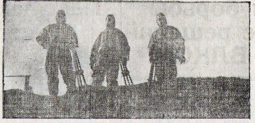
На учении по противовоздушной обороне Ленинграда. На снимке: звено химической разведки 10-го хлебозавода в Выборгском районе на станции Куселевка за работой.

Законочено переоборудование помещения бывшей церкви под клуб в колхозе «Шенфельд» Лизандергейского кантона.