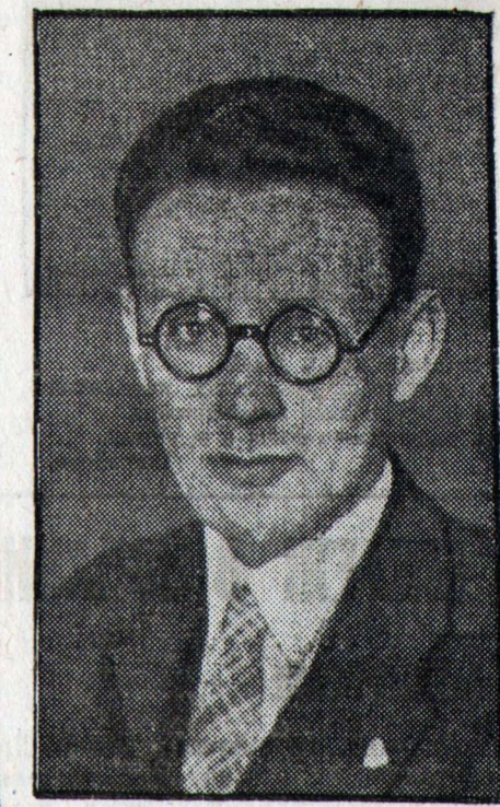
Участник третьего московского международного шахматного турнира гроссмейстер Михаил Ботвинник.

Молодой советский шахматист, инженер-электрик, аспирант одной из ленинградских лабораторий Наркомтяжпрома, комсомолец Михаил Ботвинник вышел победителем в международном шахматном турнире в Ноттингэме.