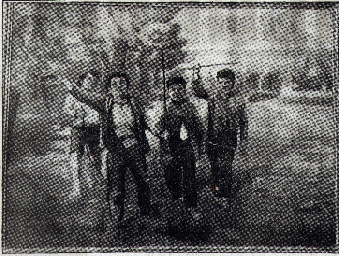
Тифлисская выставка живописи, скульптуры и графики на тему: «К истории большевистских организаций Грузии и Закавказья». На снимке: картина художника Д. Волгина «Сталин в детстве».

Свое слово Эмануил сдержал. С начала уборки он идет первым по количеству и качеству убраных гектаров. На 25 августа агрегатом Эмануила Гельд убрано 600 гектаров.