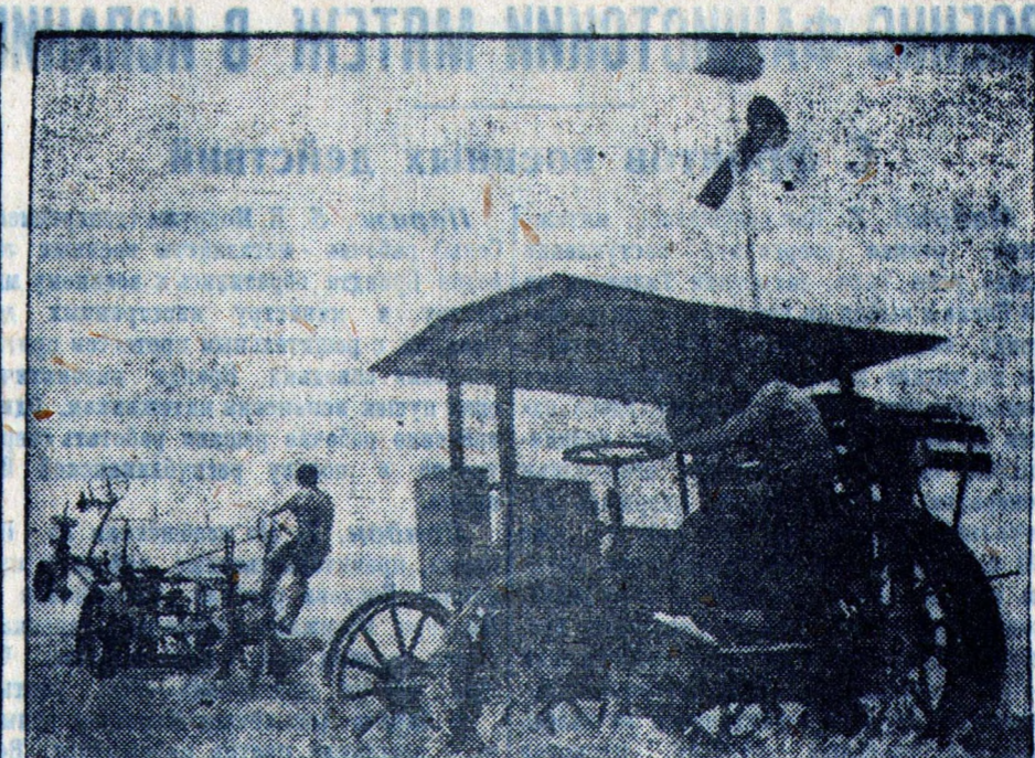
Днепропетровским филиалом Всесоюзного научно-исследовательского института электрификации сельского хозяйства (Запорожский район, Днепропетровская область) широко внедряется электрификационная техника.

Савинский колхоз „Красный партизан“ 2 сентября закончил выполнение плана озимого сева.