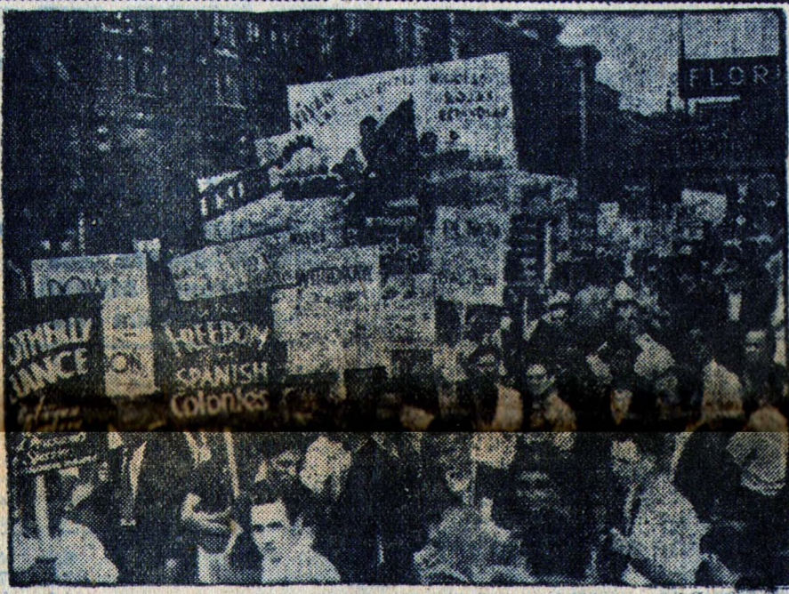
Движение солидарности с испанским народом. В нью-йоркском квартале Нью-Йорк - Гарлем состоялась большая демонстрация солидарности с испанским народом и протеста против фашистской интервенции в Испании.

в кабинет, НКТ, однако, постановила оказать решительную поддержку новому правительству, чтобы оно могло выполнять основную задачу - сокрушения фашистского мятежа.