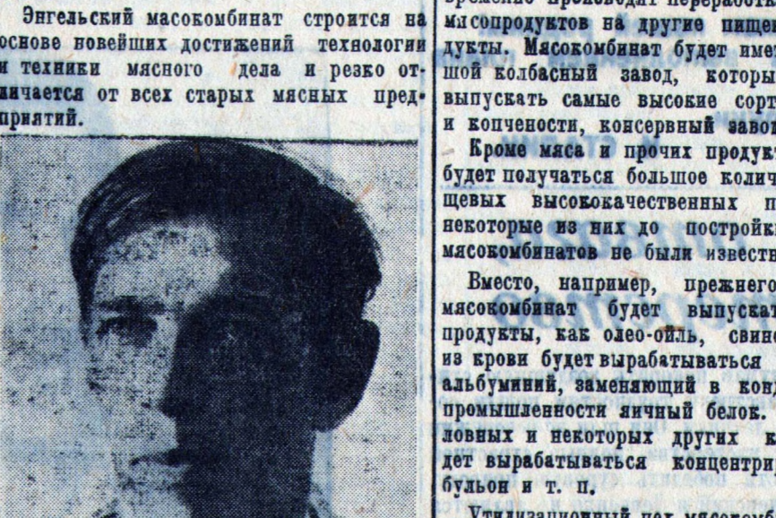
Прежние бойни, хладобойни, мясохладобойни в основу своей работы ставили боевое дело — их назначение было забить скот, охладить или заморозить мясо и возможно позже и скорее переработать прочие продукты, получившиеся в результате убои и разделки туш (шкура, жир, кишки и проч.).

Около ст. Аппосова РУЖд, в непосредственной близости от места будущего нового социалистического города Энгельса — строится первое промышленное предприятие в этом районе — Энгельский мясокомбинат — гигант мясной индустрии, который станет в один ряд с другими гигантами — мясокомбинатами — московскими, ленинградскими и семипалатинскими. Энгельский мясокомбинат строится на основе новейших достижений технологии и техники мясного дела и резко отличается от всех старых мясных предприятий.