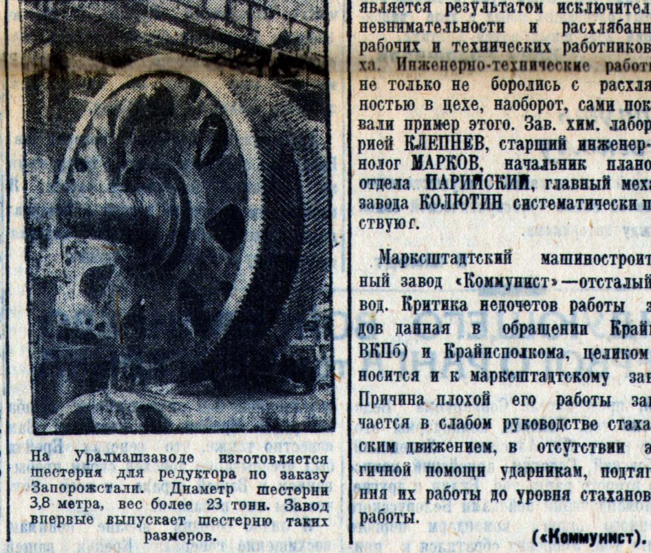
На Уралмашзаводе изготавливается ступенчатая для редуктора по заказу Запоржстали. Диаметр ступеней 3,8 метра, вес более 23 тонн. Завод впервые выпускает ступени таких размеров.