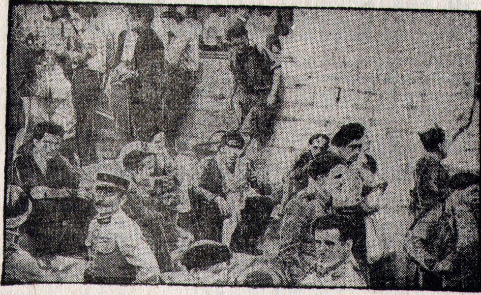
На снимке: группа рабочей милиции, не желая сдаваться мятежникам, укрывается на французском берегу Бадассоа.