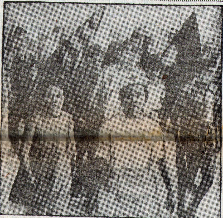
На снимке: демонстрация детей на улицах Барселоны, организовавших сбор средств в пользу рабочей милиции.

Мы обращаемся ко всем железнодорожникам Советского Союза с горячим призывом поддержать испанский народ в его тяжелой, но славной борьбе. Среди свободных граждан счастливой страны социализма не должно быть и не будет безучастных к великому делу помощи героическим бойцам демократической Испании.