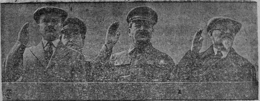
Первомайский парад на Красной площади.